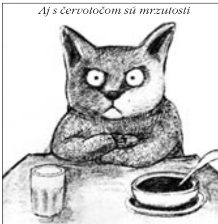
Aj s červotočom sú mrzutosti

Celé znenie si môžete požičať na fare alebo - veríme v blízkom čase - pozrieť na http://ecav.rbk.sk (história).